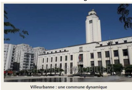
Villeurbanne : une commune dynamique